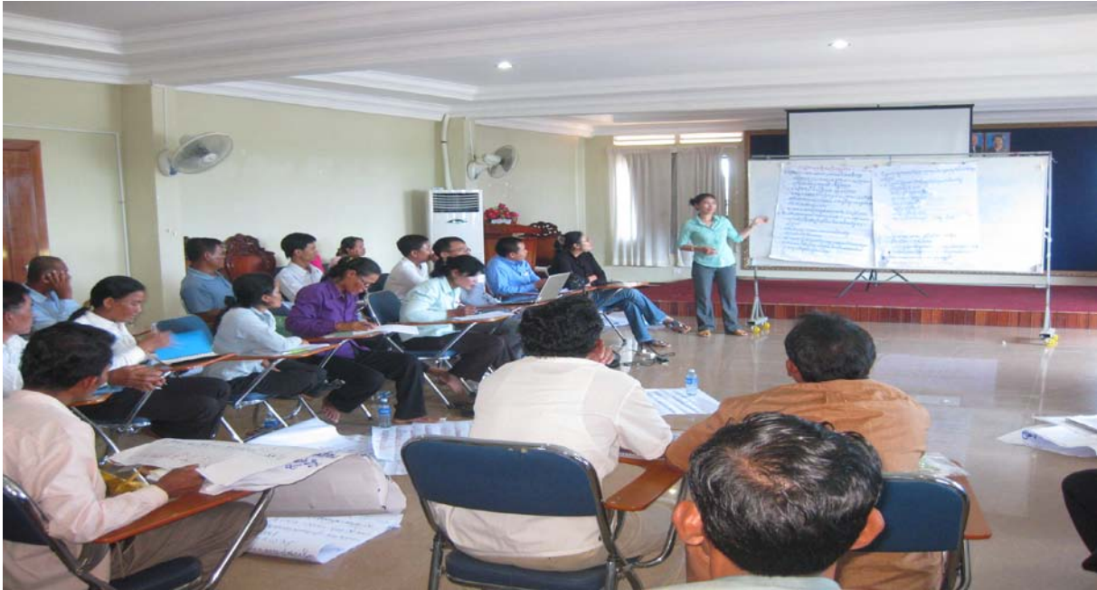
ថ្ងៃទី៣: ១៥ កញ្ញា ២០១១

ក្រោយពីភារកិច្ចាលើសំនួរទាំងបីខាងលើ ក្រុមនីមួយៗបានធ្វើការបង្ហាញនូវលទ្ធផលភារកិច្ចារបស់ខ្លួនដោយ ប្រើពេល២ នាទីក្នុងមួយក្រុម។ (រូបភាព)